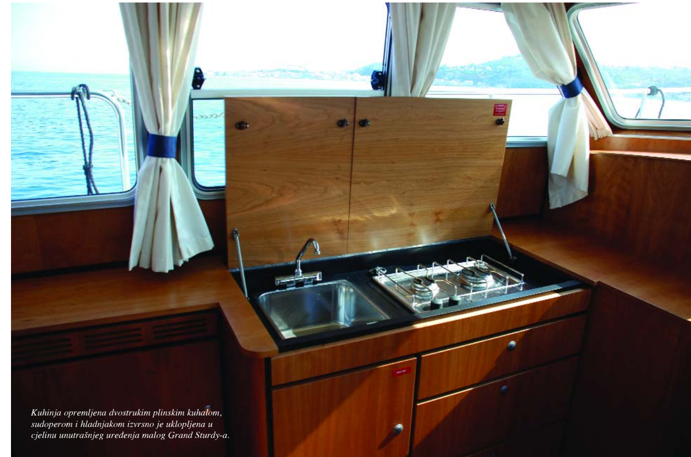
Kuhinja opremljena dvostrukim plinskim kuhalom, sudoperom i hladnjakom izvrsno je uklopljena u cjelinu unutrašnjeg uređenja malog Grand Sturdy-a.

Iz kokpita se kroz dvodjelna vrata (donji su dio klasična vrata a gornji klizni poklopac) spušta u prostrani i svjetli salon u čijem se lijevom dijelu nalazi i kuhinja. Dizajnirana kao jedan funkcionalni komad namještaja, kada se ne koristi, od pogleda se skriva poklopcem koji je ujedno i prostrana radna ploha. Kuhinja je na ovom modelu podignuta na isti nivo sa salonom, što znatno olakšava njeno korištenje pa se sada cijeli život u unutrašnjosti odvija na istom nivou. Svi