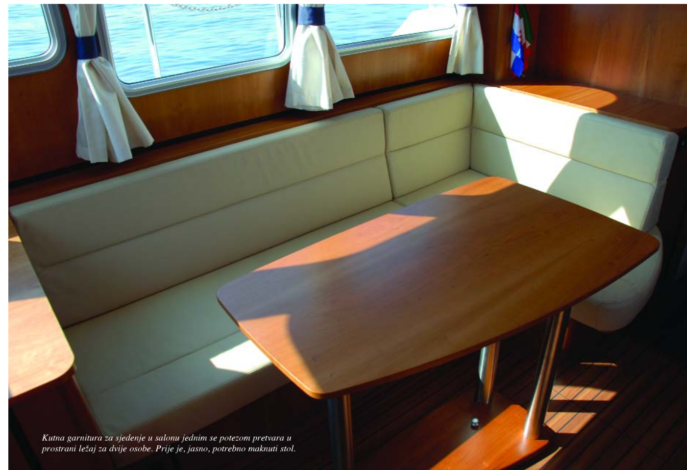
Kutna garnitura za sjedenje u salonu jednim se potezom pretvara u prostrani ležaj za dvije osobe. Prije je, jasno, potrebno maknuti stol.

ormarići i sve ravne plohe u salonu su iste visine što stvara vizualni dojam mirnoće, ugone i sklada.